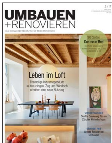
Umbauen + Renovieren

Publikationen aus dem ARCHITHEMA Verlag, der Schweizer Verlag für Architektur, Design, Umbau, Renovation und Wohnkultur