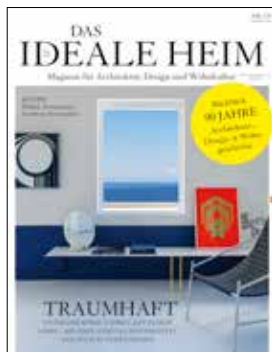
Das Ideale Heim