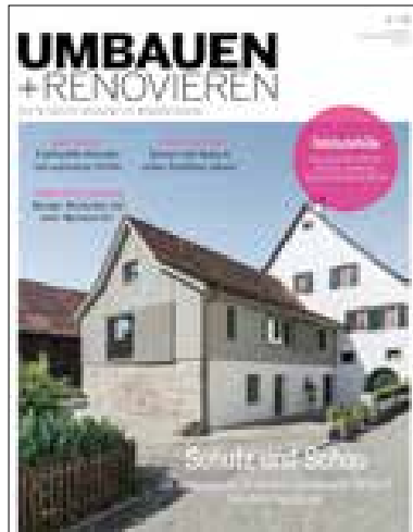
Umbauen + Renovieren

Publikationen aus dem ARCHITHEMA Verlag, der Schweizer Verlag für Architektur, Design, Umbau, Renovation und Wohnkultur